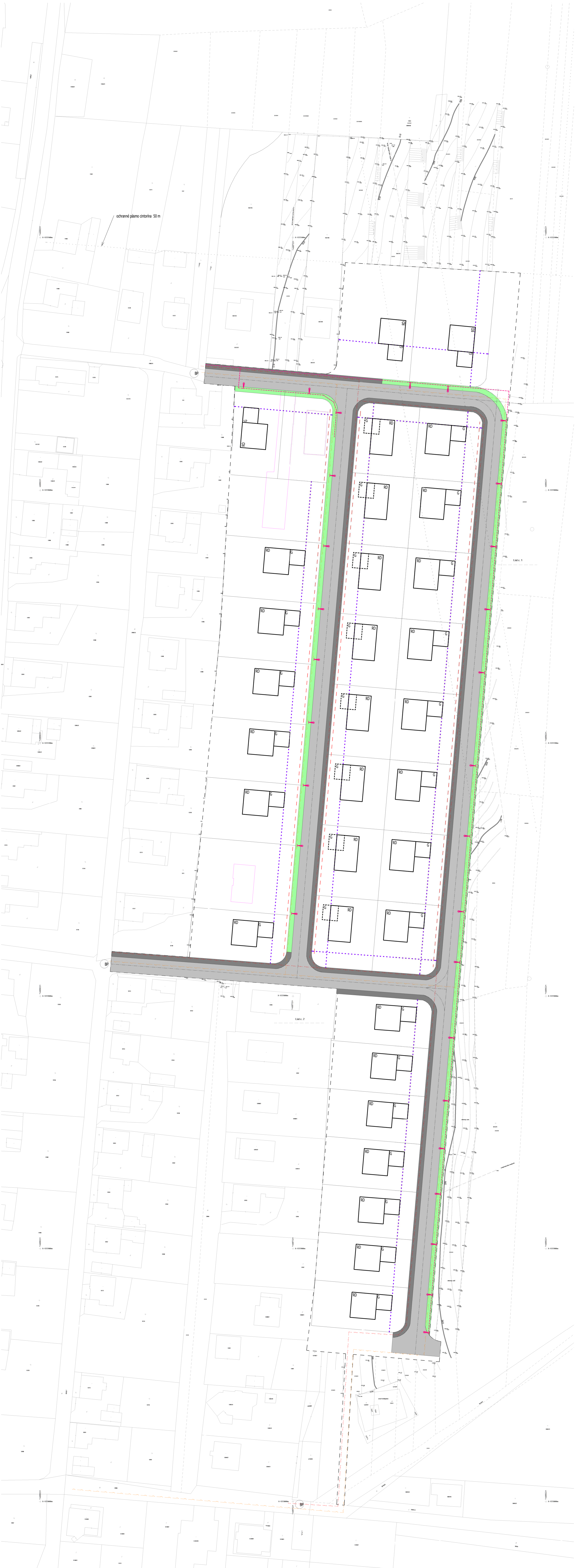
Výkres tech. vybav.- POD HRBOM – plyn 1 : 500