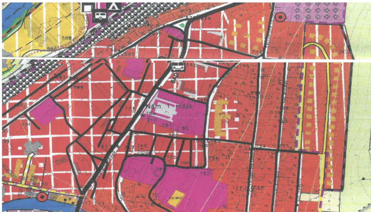
Výrez z Územného plánu sídelného útvaru Valaská – Komplexný urbanistický návrh