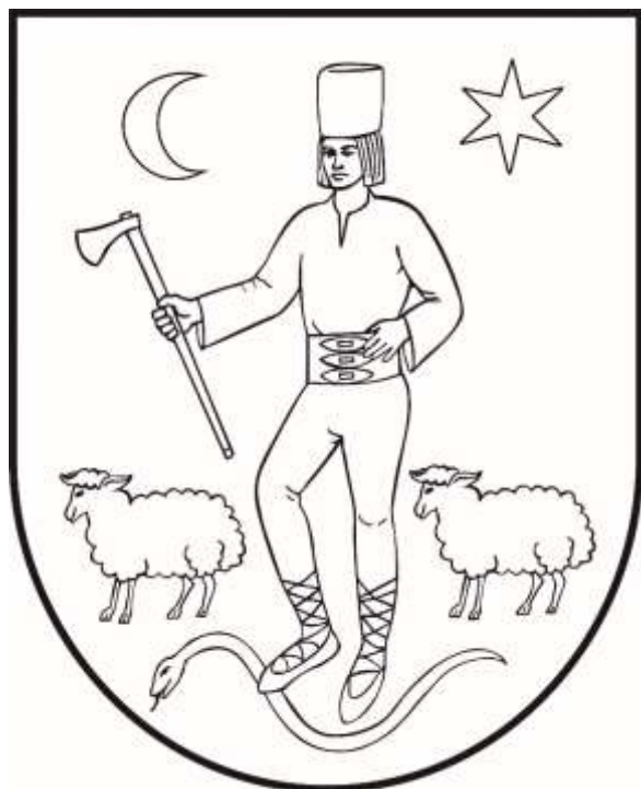
ERB OBCE VALASKÁ (čierno-biela verzia)