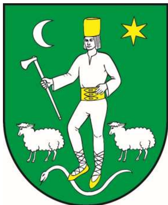
ERB OBCE (farebná verzia)