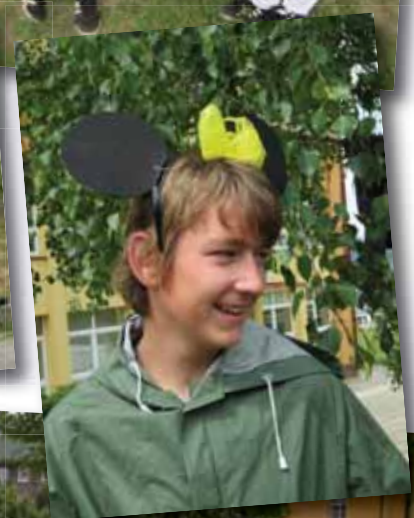
Ku krásnemu dňu prispeli aj kuchárky ZŠ.