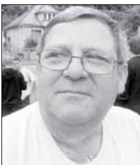
Tabuľka strelcov gólov

Väčšinu zápasov sme zvládli aj po taktickej stránke. Náš prejav bol na solídnej úrovni, mali sme dobrý prechod z obrany do útoku, ale smerom dozadu to bolo