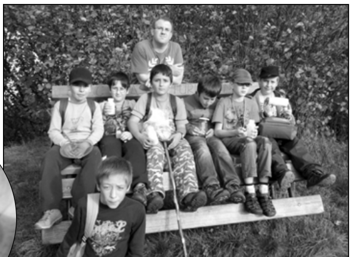
Členovia entomologického krúžku