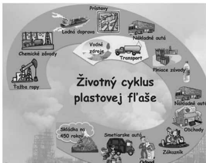
Uloženie plastov na skládku odpadov