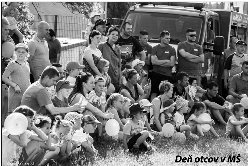
Deň otcov v MŠ

Niektorí OCKOVIA už nie sú medzi nami, no to, čo pre nás urobili, si budeme vo svojom srdci uchovávať po celý život. Aj keď tu už nie