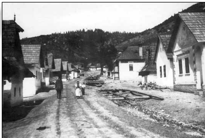
Krčma U Dolníkov – štvrtá stavba vpravo