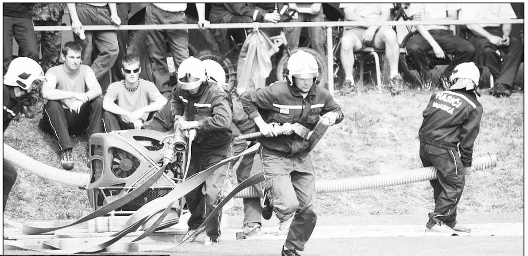
Previerka pripravenosti 4.6.2011, VALASKÁ