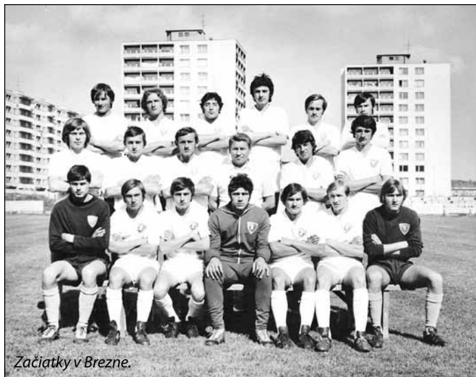
Začiatky v Brezne.