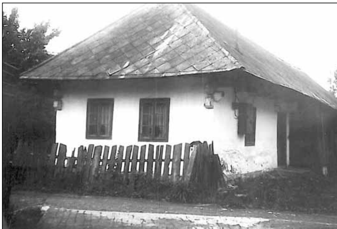
Dom mlynárskej rodiny Opaterných na Studničke. Pôvodne bol so šindľovou strechou a menšími oknami.