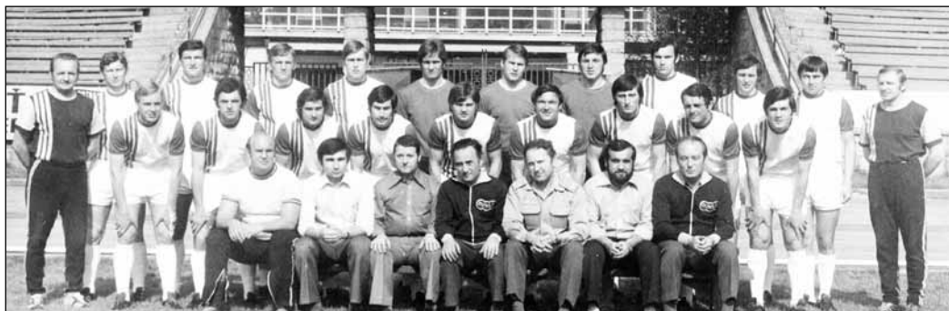
Dukla Banská Bystrica.

„V ligovom utkaní se Slávií v Ede- nu splnil nenápadný 170 cm vysoký a 70 kg ťžký banskobystrický obránce beze zbytku úkol střežit