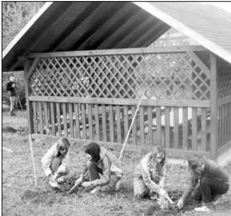
Na nie je to krajšie ako kopa smeti?