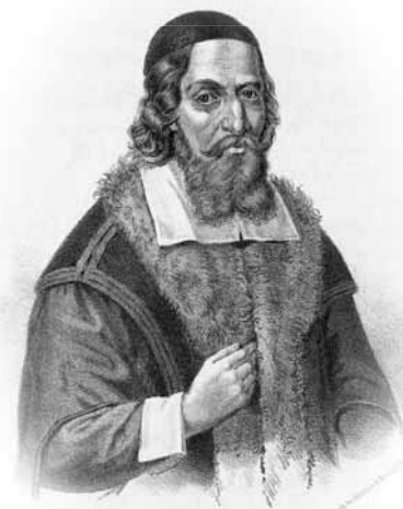
Jan Amos Komenský

Zhmotňuje sa vo vedomí ľudstva v tých najlepších snahách svojich synov a dcér.